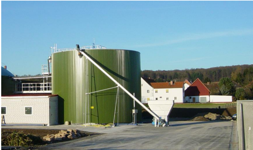
Abb. 4: Feststoffeintragstechnik in den Fermenter

Die Nachgärung besteht aus einem Betonbehälter mit einem Volumen von ca. 1.000 m 3 , der mit einem Doppelmembrangassspeicherdach ausgerüstet ist. Aus dem Gasspeicher wird das Biogas direkt einem Zündstrahlaggreat zugeführt. Dabei handelt es sich um einen Motor mit einer elektrischen Leistung von 160 kW, der in einem Container untergebracht ist. Der Motor liefert das heiße Wasser für den Wärmetauscher. Außerdem wird das Hofgebäude samt Seminarhaus mit Wärme versorgt.