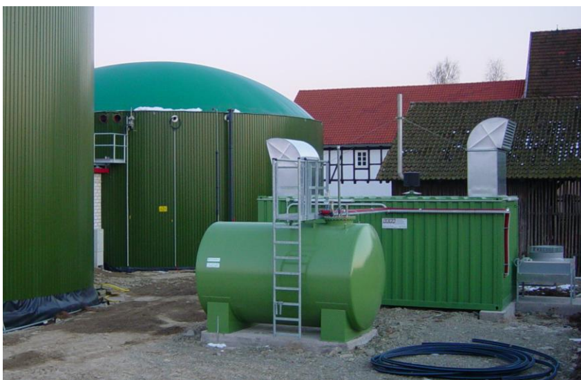
Abb. 5: Nachgärer mit BHKW

Die Biogasanlage ist in Ortsrandlage in enger Nachbarschaft zum Hofgebäude des landwirtschaftlichen Betriebs errichtet worden. Daher war die Minimierung von Emissionen im kontinuierlichen Betrieb der Anlage eine strikte Vorgabe des Bauherrn und wurden planerisch entsprechend umgesetzt. Für die Zukunft ist die wärmetechnische Anbindung weiterer Häuser angedacht.