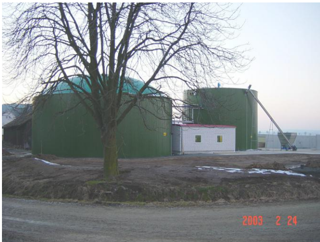
Abb. 1: Gesamtüberblick Biogasanlage OBERNJESA